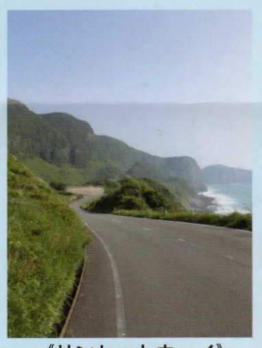
《サンセットウェイ》