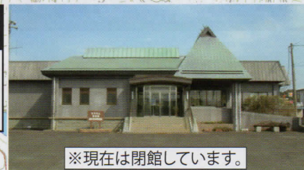
※現在は閉館しています。