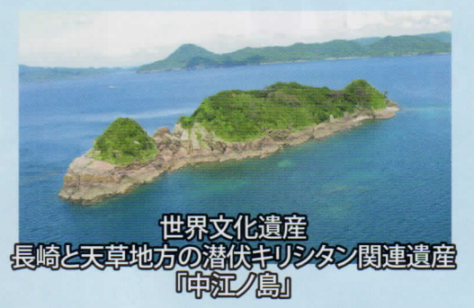
世界文化遺産 長崎と天草地方の潜伏キリシタン関連遺産「中江ノ島」