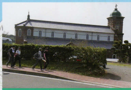
田平天主堂 (国重要文化財)