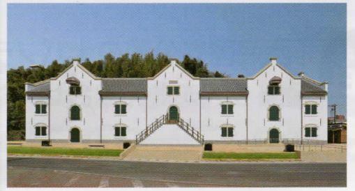
平戸オランダ商館